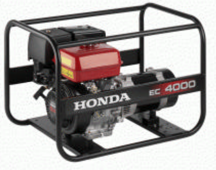
Modèle : EM4500CX(S)

Grâce à sa grande puissance de 4500 W allié à une régulation de type AVR, l'EM4500 peut alimenter des équipements à la fois gourmands en courant et sensibles aux variations de tension. Sécurité manque d'huile et jauge à carburant de série garantissent une parfaite sécurité d'utilisation. Existe en version démarrage électrique. De nombreuses options disponibles pour s'adapter à toutes les demandes : Kit de transport 2 / 4 roues, Horamètre, crochet de levage, commande à distance.