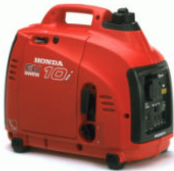
Modèle : EU10i

Compact et pratique (13kg) ce groupe se porte aisément avec sa large poignée de transport. Il peut fournir un courant d'excellente qualité grâce à sa régulation Inverter. Son habillage complet assure une très bonne insonorisation. Le système "interrupteur Eco" gère la mise au ralenti automatique du moteur permettant d'augmenter grandement l'autonomie, et de réduire encore plus le niveau de bruit. Confort d'utilisation, qualité de courant, grande autonomie permettent à ce groupe d'alimenter les appareils les plus sensibles et pendant longtemps. Possibilité de montage en parallèle pour porter la puissance disponible à 2000 W.