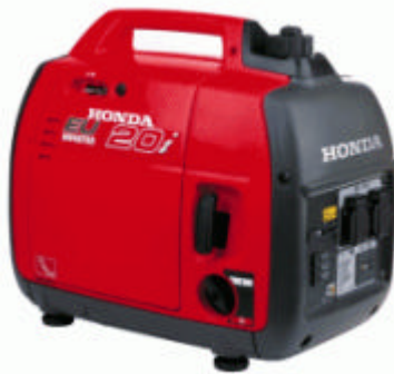
Modèle : EU20i

Compact et équilibré ce groupe se porte aisément avec sa large poignée de transport. Il peut fournir un courant d'excellente qualité (régulation Inverter) et d'une puissance importante atteignant jusqu'à 2000 W. Son habillage complet assure une très bonne insonorisation. Le système "interrupteur Eco" gère la mise au ralenti automatique du moteur permettant d'augmenter grandement l'autonomie, et de réduire encore plus le niveau de bruit. Ce groupe combine tous les avantages : silence, grande autonomie, qualité et puissance du courant. Possibilité de montage en parallèle pour porter la puissance disponible à 4000 W.